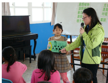
科博館到校－認識植物