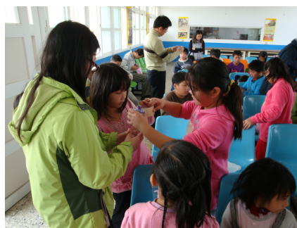
科博館到校－製作聲砲