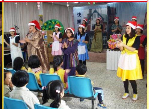
向日葵學園蒞校表演