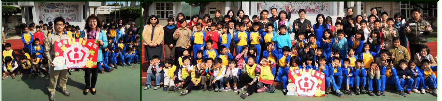
自治鎮長徐政烜獻上全校簽名

因此下學期即將辦理 50 週年校慶，期許各位家長及校友能多多參與學校的活動，大家共同為學校的生日舉辦一個溫馨而隆重的慶典。