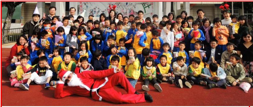
聖誕節活動全校合照