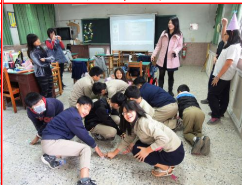
聖誕節英語闖關活動