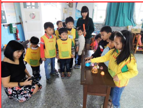
聖誕節英語闖關活動