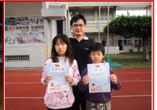
頒發自治鎮長當選證書