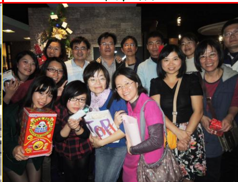
聖誕夜教職員聚餐