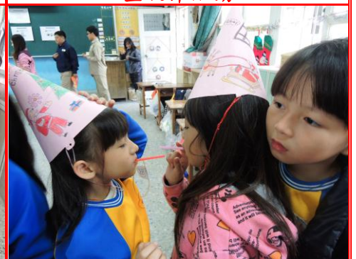
聖誕節英語闖關活動