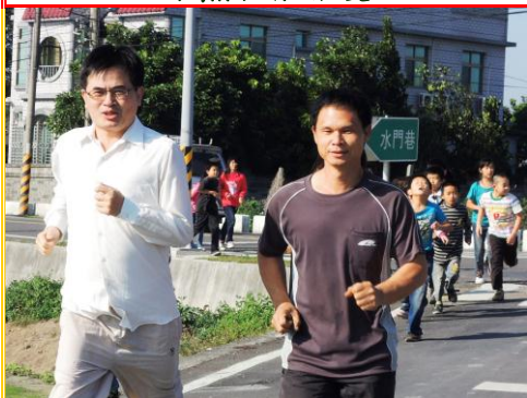
歲末年終迎新路跑活動