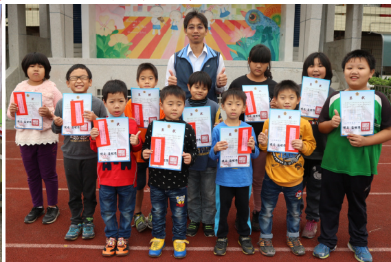
第 2 次定期評量進步獎學生