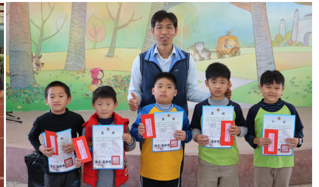
第 3 次定期評量進步獎學生