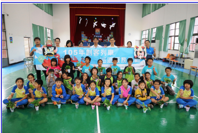
105.11.11 創客下鄉：4-6 年級水轉印