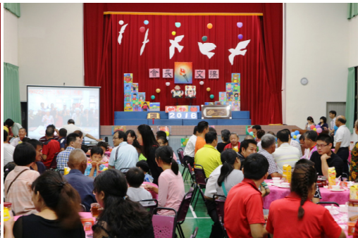
感謝貴賓熱情參與