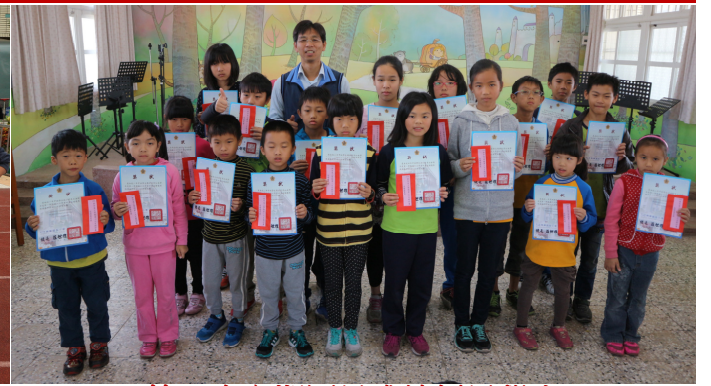
第 3 次定期評量成績優異學生