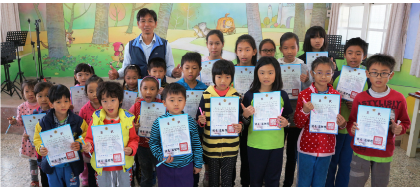
105 學年度第 1 學期榮譽制度日常表現優良