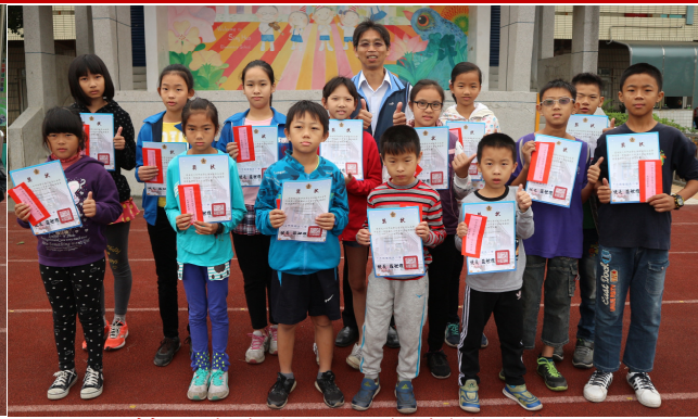
第 2 次定期評量成績優異學生