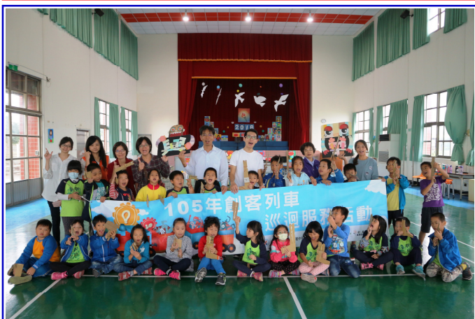
105.11.11 創客下鄉：1-3 年級紙手槍