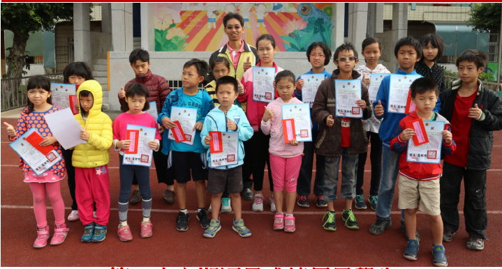
第 1 次定期評量成績優異學生