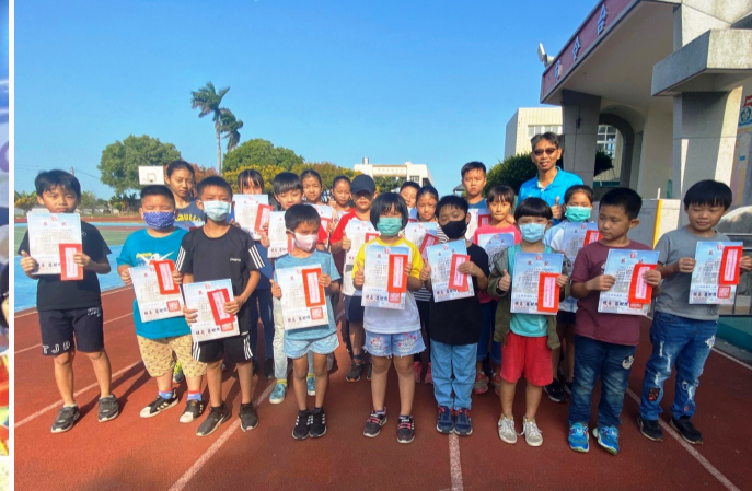
暑假作業展得獎同學與校長合影