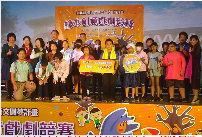
五甲師生參加「繪本創意戲劇競賽」榮獲優選