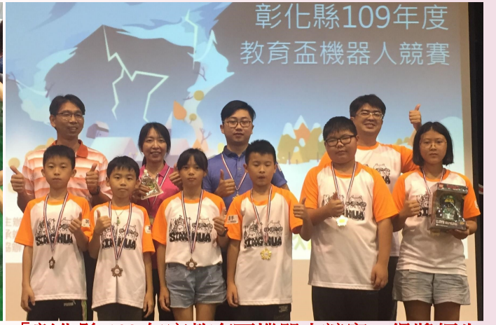
「彰化縣 109 年度教育盃機器人競賽」得獎師生