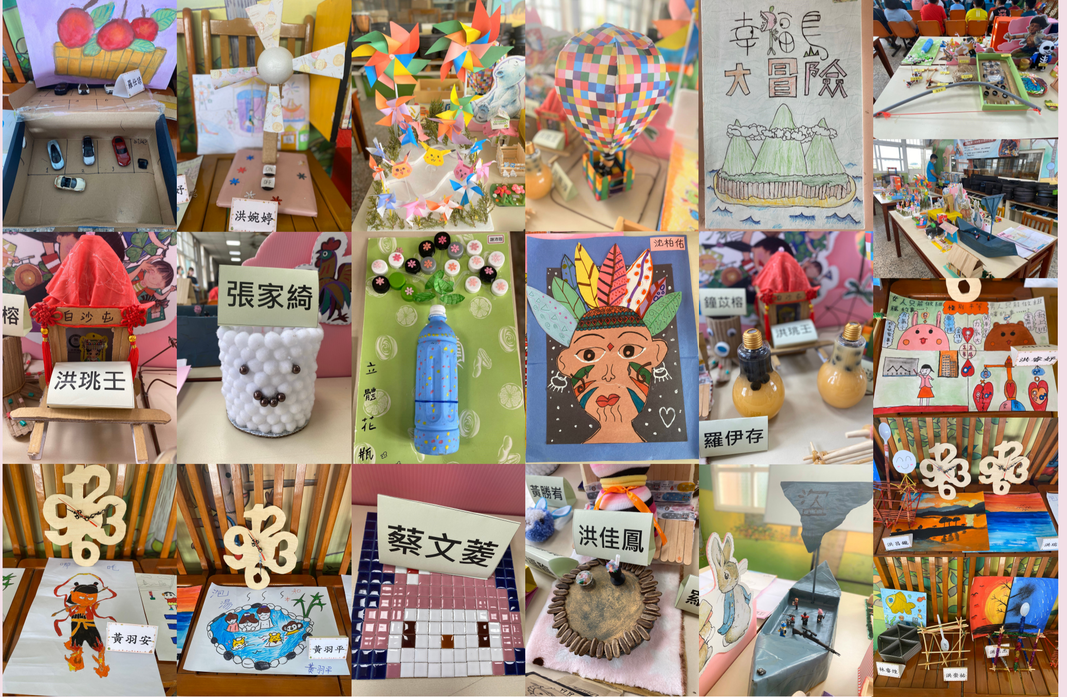
暑假作業展學生作品