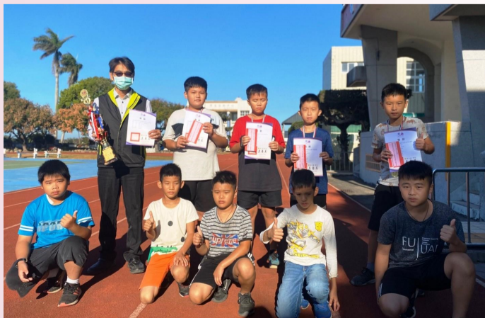
推手錦標賽參賽同學與校長合影